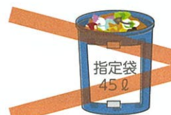
中身の入った ごみバケツ